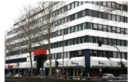
Campus FHM Köln