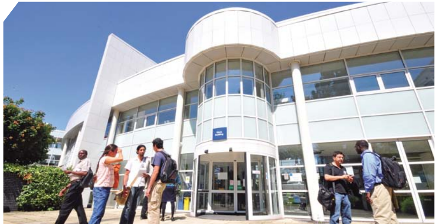
Park Campus Cheltenham

Der Besuch promotionsbegleitender Veranstaltungen auf dem Campus der Business School der University Gloucestershire in Cheltenham ist darüber hinaus möglich. Alle Promotionsstandorte liegen verkehrsgünstig und sind gut mit öffentlichen Verkehrsmitteln (auch vom jeweils nächstgelegenen Flughafen) zu erreichen. Die modernen Seminarräumlichkeiten verfügen über bestmögliche technische Ausstattung und bieten somit ein optimales Lernumfeld.