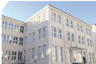
Campus FHM Bielefeld